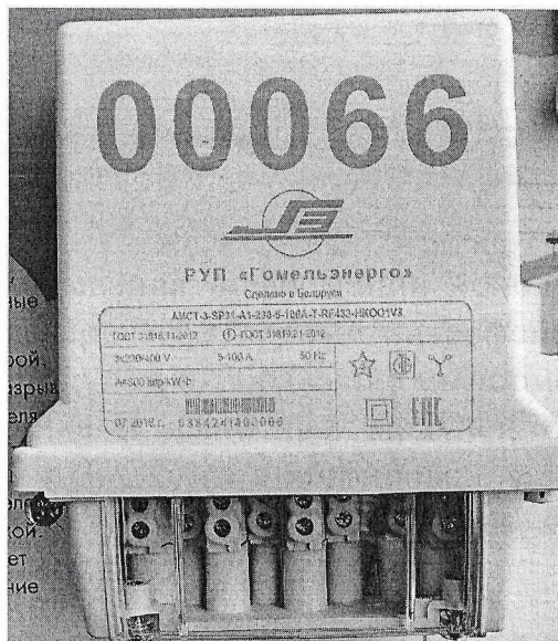
Рисунок 2 – Внешний вид счетчика.

Внешний вид счетчика и выносных модулей отображения информации представлен на рисунках 2 и 3. Схемы пломбирования счетчиков от несанкционированного доступа к элементам счетчика с указанием мест нанесения знаков проверки приведены в приложении А.